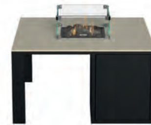
ALESSO 90 negro / arena

Estructura: Ref: ALEB0090 | EAN: 8414706007034 Sobre: Ref: ENCT0090 | EAN: 8414706007041