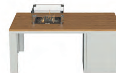
ALESSO 120 COLLECTA blanco / teca

Estructura: Ref: ALEB0120 | EAN: 8414706006938 Sobre: Ref: ENCP0120 | EAN: 8414706007010