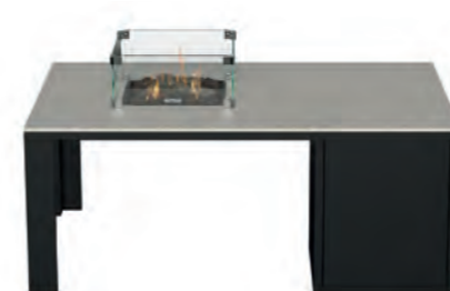
ALESSO 120 COLLECTA negro / piedra

Estructura: Ref: ALEN0120 | EAN: 8414706006921 Sobre: Ref: ENCG0120 | EAN: 8414706007003