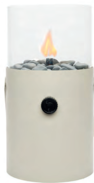
COSISCOOP ORIGINAL marfil Ref: COSI0003 EAN: 8712757456499