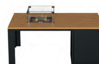
ALESSO 120 COLLECTA negro / teca

Estructura: Ref: ALEN0120 | EAN: 8414706006921 Sobre: Ref: ENCP0120 | EAN: 8414706007010