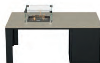
ALESSO 120 COLLECTA negro / arena

Estructura: Ref: ALEB0120 | EAN: 8414706006938 Sobre: Ref: ENCT0120 | EAN: 8414706006983