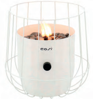
COSISCOOP BASKET blanco Ref: COSI0006 EAN: 8712757458882