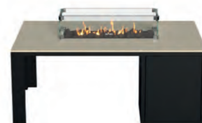
ALESSO 120 LINEA negro / arena

Estructura: Ref: ALEB0120 | EAN: 8414706006938 Sobre: Ref: ENLT0120 | EAN: 8414706006945