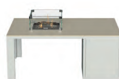
ALESSO 120 COLLECTA blanco / arena

ESTRUCTURA: Aluminio blanco o negro. SOBRE: Madera de teca natural o piedra sinterizada Neolith® en color arena, gris plomo y piedra. MEDIDAS: 120 x 80 x 47 cm QUEMADOR: Cuadrado 30 x 30 x 11 cm. ALIMENTACIÓN: Botella propano BUTSIR PRO 5 kg CONSUMO: 509 g/h máx POTENCIA: 7.000 W INCLUYE: Cristal protector, troncos cerámicos, piedra volcánica y funda de protección. Botella no incluida.