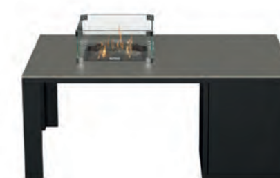
ALESSO 120 COLLECTA negro / gris plomo

Estructura: Ref: ALEN0120 | EAN: 8414706006921 Sobre: Ref: ENCA0120 | EAN: 8414706006990