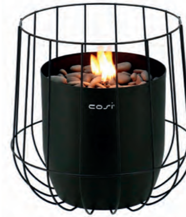
COSISCOOP BASKET negro Ref: COSI0008 EAN: 8712757458899