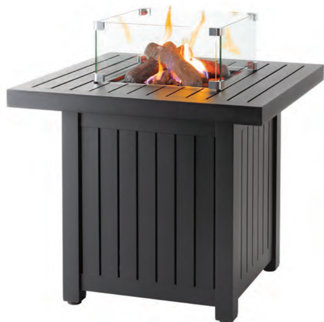
Ref: FIRE0018 EAN: 8414706006815