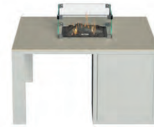
ALESSO 90 blanco / arena

ESTRUCTURA: Aluminio blanco o negro. SOBRE: Madera de teca natural o piedra sinterizada Neolith® en color arena, gris plomo y piedra. MEDIDAS: 90 x 90 x 47 cm QUEMADOR: Cuadrado 30 x 30 x 11 cm. ALIMENTACIÓN: Botella propano BUTSIR PRO 5 kg CONSUMO: 509 g/h máx POTENCIA: 7.000 W INCLUYE: Cristal protector, troncos cerámicos, piedra volcánica y funda de protección. Botella no incluida.