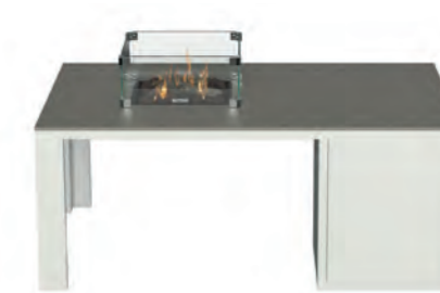
ALESSO 120 COLLECTA blanco / gris plomo

Estructura: Ref: ALEB0120 | EAN: 8414706006938 Sobre: Ref: ENCA0120 | EAN: 8414706006990