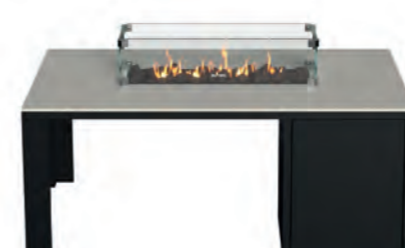
ALESSO 120 LINEA negro / piedra

Estructura: Ref: ALEN0120 | EAN: 8414706006921 Sobre: Ref: ENLG0120 | EAN: 8414706006969