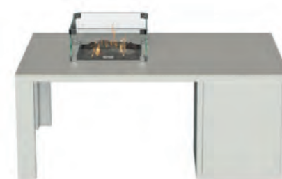
ALESSO 120 COLLECTA blanco / piedra

Estructura: Ref: ALEB0120 | EAN: 8414706006938 Sobre: Ref: ENCG0120 | EAN: 8414706007003