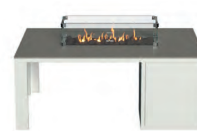
ALESSO 120 LINEA blanco / gris plomo

Estructura: Ref: ALEB0120 | EAN: 8414706006938 Sobre: Ref: ENLA0120 | EAN: 8414706006952