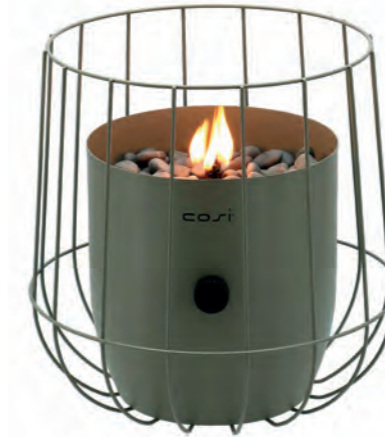
COSISCOOP BASKET verde oliva Ref: COSI0007 EAN: 8712757458875