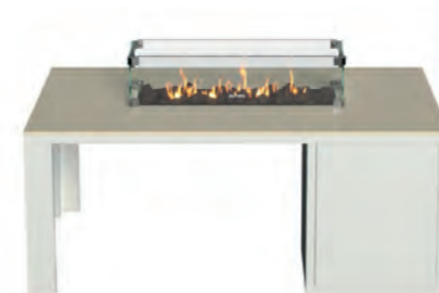
ALESSO 120 LINEA blanco / arena

ESTRUCTURA: Aluminio blanco o negro. SOBRE: Madera de teca natural o piedra sinterizada Neolith® en color arena, gris plomo y piedra. MEDIDAS: 120 x 80 x 47 cm QUEMADOR: Lineal 60 x 22 x 11 cm ALIMENTACIÓN: Botella propano BUTSIR PRO 5 kg CONSUMO: 619 g/h máx POTENCIA: 8.500 W INCLUYE: Cristal protector, piedra volcánica y funda de protección. Botella no incluida.