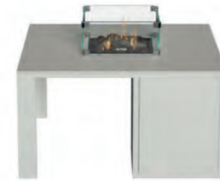
ALESSO 90 blanco / piedra

Estructura: Ref: ALEB0090 | EAN: 8414706007034 Sobre: Ref: ENCG0090 | EAN: 8414706007065