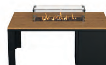
ALESSO 120 LINEA negro / teca

Estructura: Ref: ALEN0120 | EAN: 8414706006921 Sobre: Ref: ENLP0120 | EAN: 8414706006976