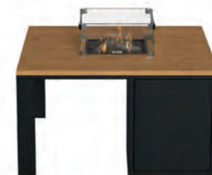
ALESSO 90 negro / teca

Estructura: Ref: ALEN0090 | EAN: 8414706007027 Sobre: Ref: ENCP0090 | EAN: 8414706007072