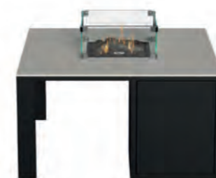
ALESSO 90 negro / piedra

Estructura: Ref: ALEN0090 | EAN: 8414706007027 Sobre: Ref: ENCG0090 | EAN: 8414706007065