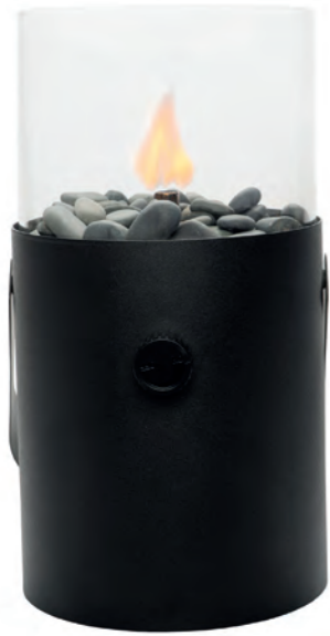
COSISCOOP ORIGINAL negro Ref: COSI0002 EAN: 8712757456505