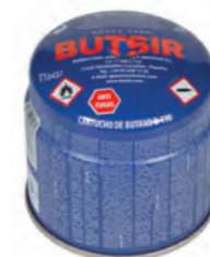
CARTUCHO B-190 MEDIDAS: Ø9 x 9 cm REF. CARB0005

Para apagar el farolillo, girar el botón completamente hacia la derecha. Eso extinguirá la llama. Guardar en un lugar bien ventilado.