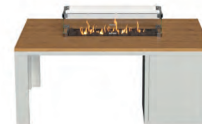
ALESSO 120 LINEA blanco / teca

Estructura: Ref: ALEB0120 | EAN: 8414706006938 Sobre: Ref: ENLP0120 | EAN: 8414706006976