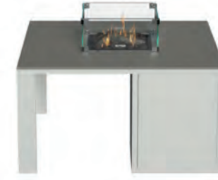
ALESSO 90 blanco / gris plomo

Estructura: Ref: ALEB0090 | EAN: 8414706007034 Sobre: Ref: ENCA0090 | EAN: 8414706007058