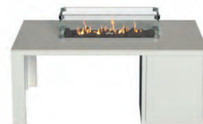
ALESSO 120 LINEA blanco / piedra

Estructura: Ref: ALEB0120 | EAN: 8414706006938 Sobre: Ref: ENLG0120 | EAN: 8414706006969