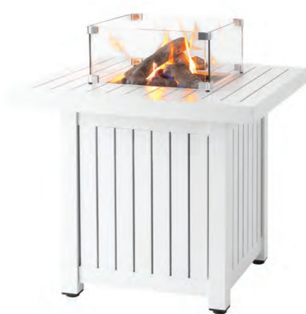
Ref: FIRE0017 EAN: 8414706006822

ESTRUCTURA: Aluminio negro o blanco mate de alta calidad. Tapa de aluminio del mismo color, para cubrir el quemador. MEDIDAS: 71 x 71 x 62 cm ALIMENTACIÓN: Botella propano BUTSIR PRO 5 kg CONSUMO: 475 g/h máx. POTENCIA: 6.800 W INCLUYE: Cristal protector, troncos cerámicos, piedra volcánica, tapa para cubrir el quemador y funda de protección. Botella no incluida.