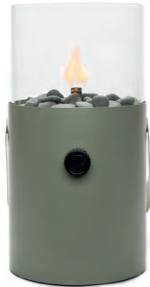
COSISCOOP ORIGINAL verde oliva Ref: COSI0004 EAN: 8712757455225