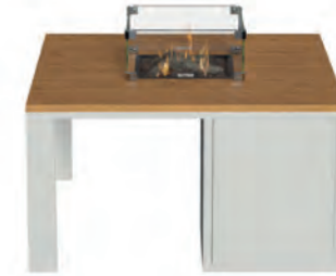
ALESSO 90 blanco / teca

Estructura: Ref: ALEB0090 | EAN: 8414706007034 Sobre: Ref: ENCP0090 | EAN: 8414706007072