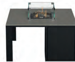
ALESSO 90 negro / gris plomo

Estructura: Ref: ALEN0090 | EAN: 8414706007027 Sobre: Ref: ENCA0090 | EAN: 8414706007058