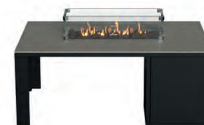
ALESSO 120 LINEA negro / gris plomo

Estructura: Ref: ALEN0120 | EAN: 8414706006921 Sobre: Ref: ENLA0120 | EAN: 8414706006952