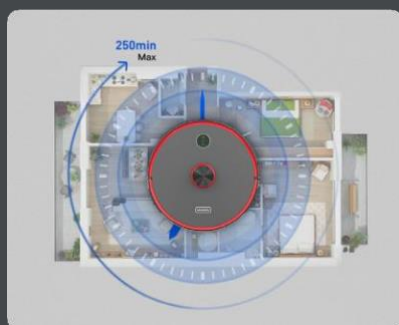
Para superficies de hasta 300 m 2 y con una autonomía de hasta 250 min.