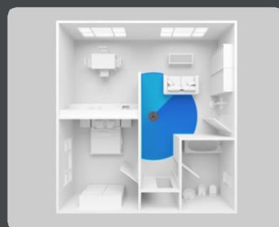
Mapeo automático, muros virtuales y navegación láser (LiDAR).